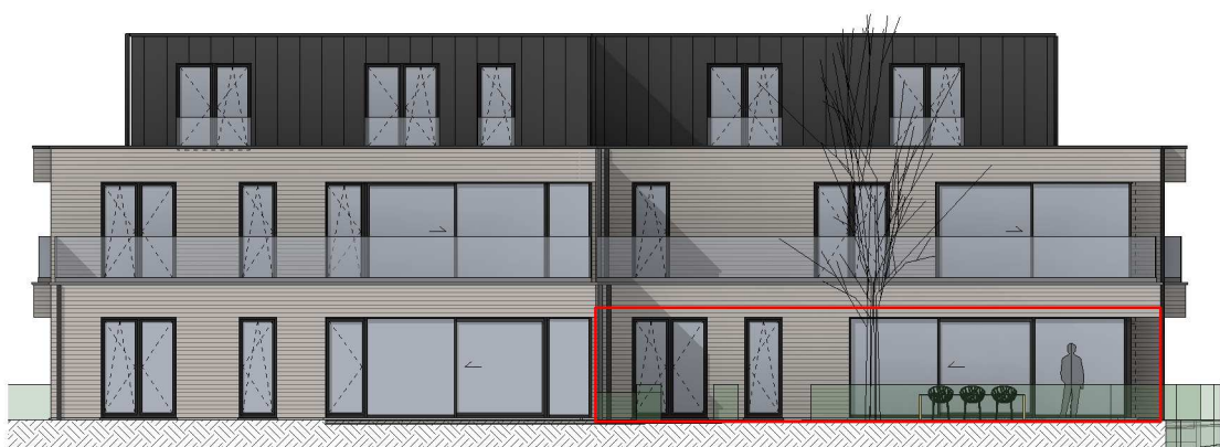
ACHTERGEVEL - schaal 1/200