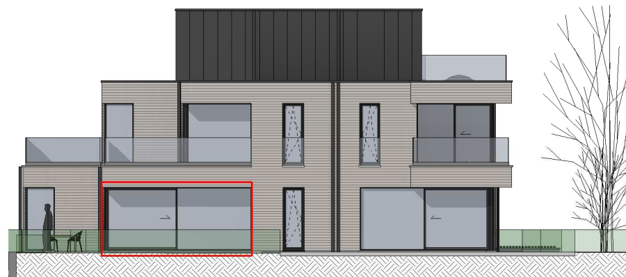
ZIJGEVEL LINKS - schaal 1/200