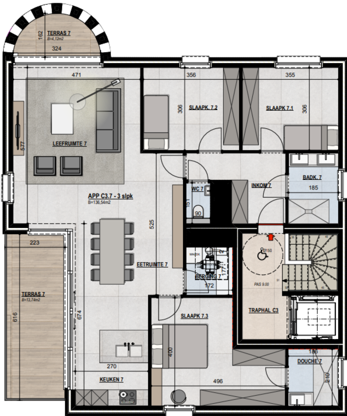
GRONDPLAN - 3de VERDIEPING - APP C3.7 - 136,54 m 2

Niet - contractueel document : alle binnenindelingen, meubels, schrijnwerk, tuininrichting en perspectieven zijn louter indicatief * structuur onder voorbehoud van stabiliteitsstudie