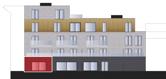
Blok A - Achtergevel