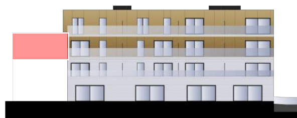
Blok B - Achtergevel