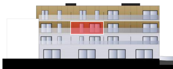
Blok B - Achtergevel