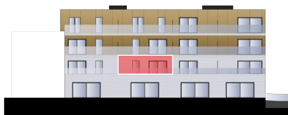
Blok B - Achtergevel