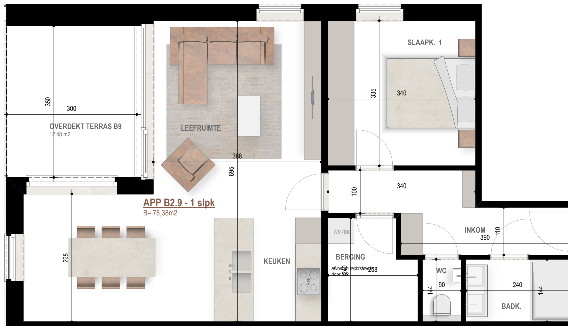
APP B2.9 - 1 slpk B= 78,38m 2